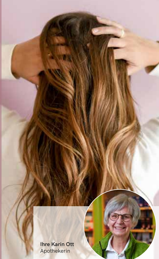
Ihre Karin Ott Apothekerin

In Haarpflegeprodukten sind oft chemische Haarfarben, Tenside und andere Stoffe enthalten, die die Haarwurzeln reizen. Empfehlenswert für eine gesunde Kopfhaut sind milde ph-neutrale Pflegeprodukte. Auch eine durchblutungsfördernde Kopfhautmassage kann hilfreich sein. Lassen Sie sich gern in Ihrer Apotheke zur Auswahl des richtigen Shampoos beraten.